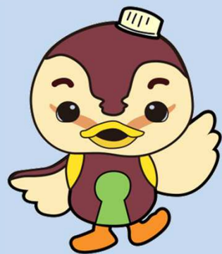
マスコットキャラクター 「とろすけ」