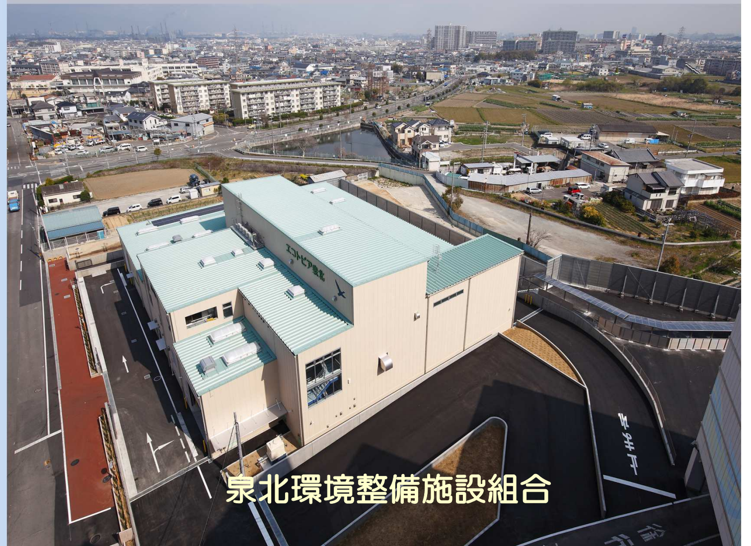
泉北環境整備施設組合