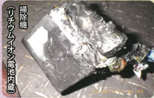
粗大ごみに小型充電式電池(モバイルバッテリー等)が内蔵されている小型家電製品が混入し、破砕機によって電池が押しつぶされて発火