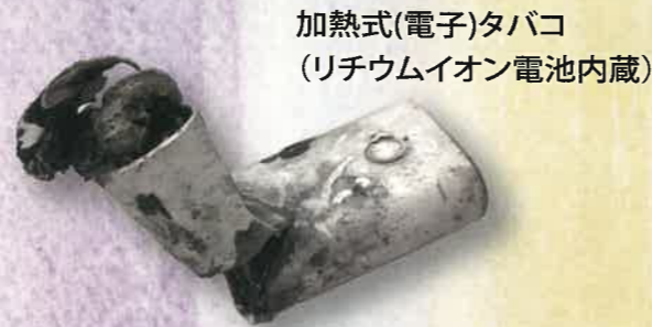
加熱式(電子)タバコ (リチウムイオン電池内蔵)

モバイルバッテリー、加熱式(電子)タバコ、電子機器のバッテリーなどのリチウムイオン電池を含む電子機器が、粗大ごみやプラスチック製容器包装のベールに混入し、ごみ収集車での巻き込み時の衝撃や粗大ごみ施設の「破砕機」によって、電池が押し潰されて、ショート・発火し、ごみ収集車やリサイクル工場での火災トラブルが近年増加しています。