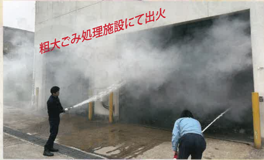
粗大ごみ処理施設にて出火