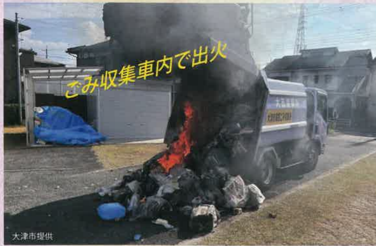
小型充電式電池(モバイルバッテリー等)が混入し、ごみ収集車の回転盤による巻き込み時の衝撃や、投入後の圧縮などがきっかけとなり発火